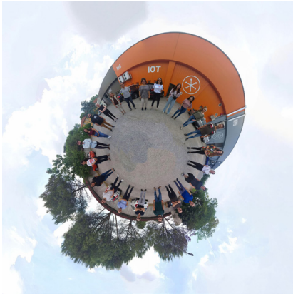
Fig. 2. Foto panoramica con i partecipanti della UID PhD Summer School 2022.

in realtà immersiva (Mattia Comelli), cui si sono aggiunti altri casi studio tra i quali la navigazione real time all'interno del padiglione dell'Esprit Nouveau di Le Corbusier. Pedro Manuel Cabezas Bernal ha illustrato il flusso di lavoro necessario per la creazione di panorami sferici (fig. 2) e il loro utilizzo nel campo del Cultural Heritage per la creazione di tour virtuali. Ha concluso la giornata l'intervento di Silvia Masserano su Le prospettive architettoniche dei teleri di Paolo Caliari, detto il Veronese .